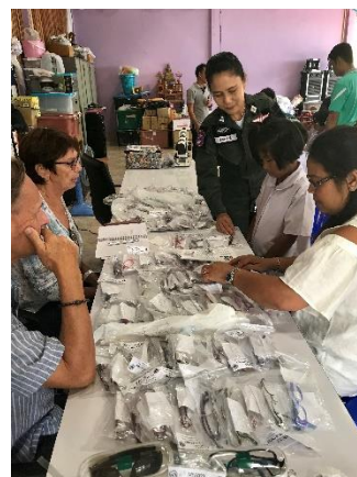
Verteilung neuer Sehhilfen in Thailand